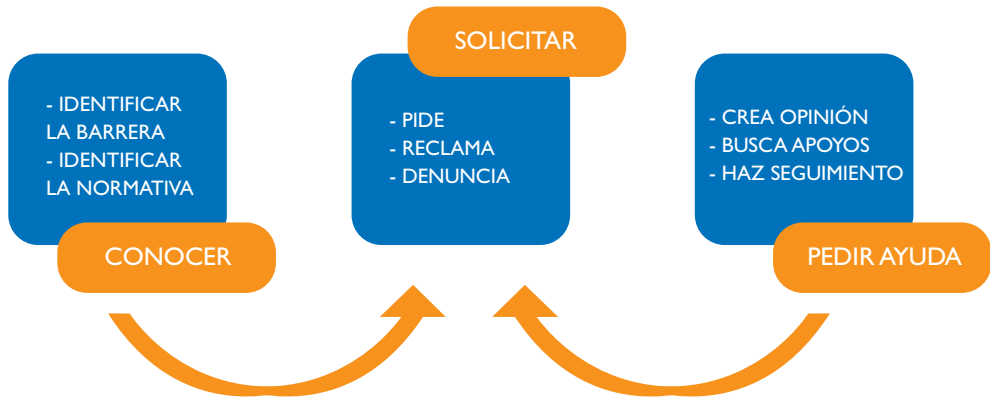
Gráfico: Guía para la Autodefensa de las Personas con Discapacidad (CERMI, 2016).

Las asociaciones y entidades trabajan para defender los derechos de las personas con discapacidad, pero son ellas mismas las que tienen que aprender a defenderse. Emponderando al alumnado con discapacidad podrán evitarse situaciones de violencia. Las personas con discapacidad deben de ser conscientes de sus derechos y se debe desde las escuelas trabajar en su empoderamiento.