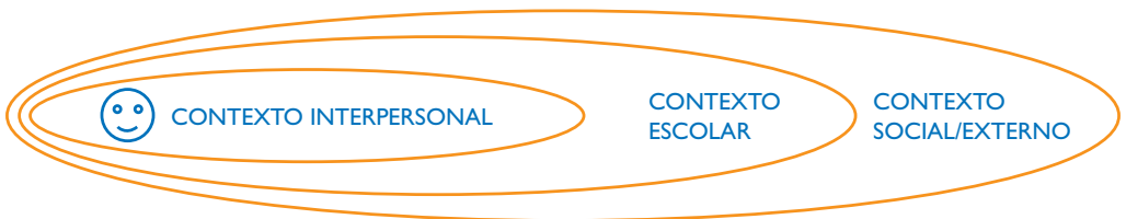
Gráfico: Modelo ecológico para la comprensión de la violencia escolar.

Para comprender el acoso escolar y concretamente el acoso escolar en niñas y niños con discapacidad es necesario realizar un análisis exhaustivo del contexto individual, escolar, económico y cultural en el que se genera.