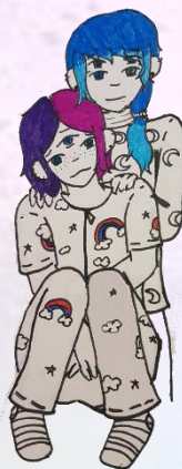
AIDEEN, 16 AÑOS

También conviene tener en cuenta que la persona trans es libre de decidir su camino, pero es conveniente que aprenda a generar herramientas en la infancia y juventud que le permitan entender su característica en lugar de huir de ella.