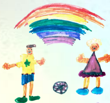
LUCAS, 7 AÑOS