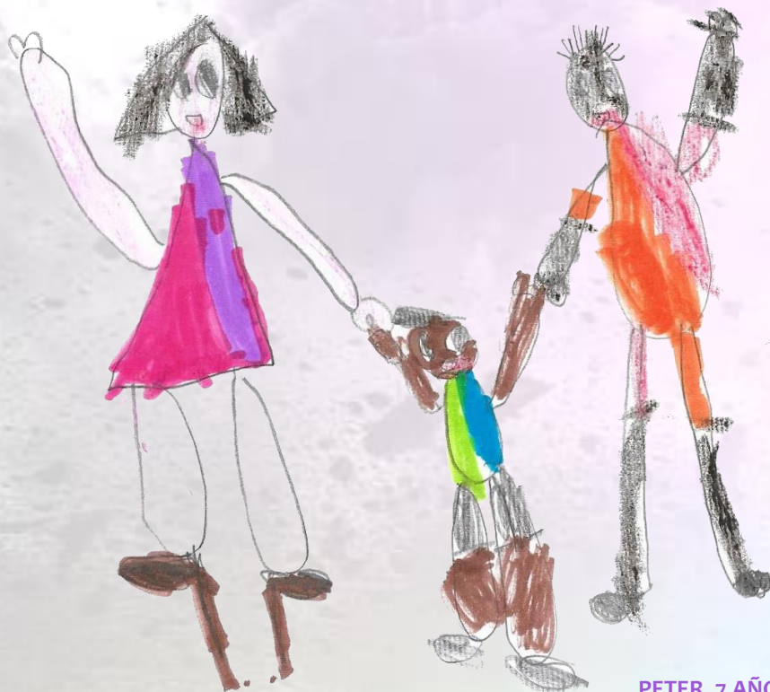
PETER, 7 AÑOS